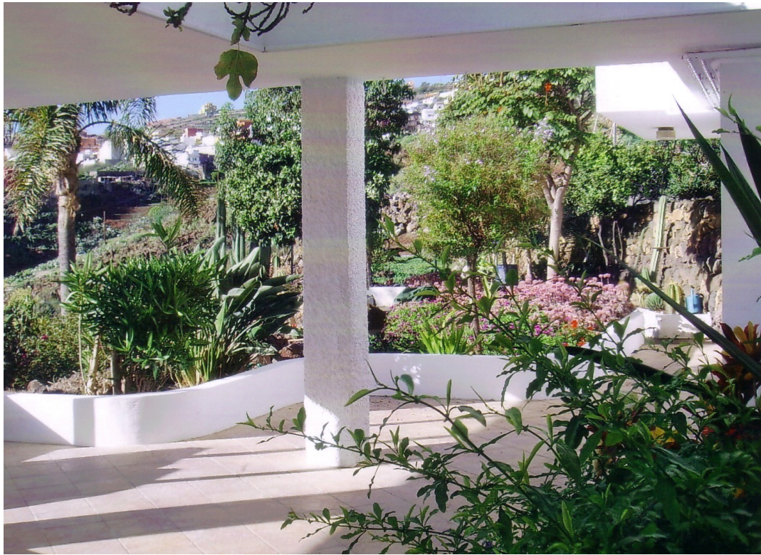
Untere Terrasse, Blick in den hinteren Bereich und in den Garten