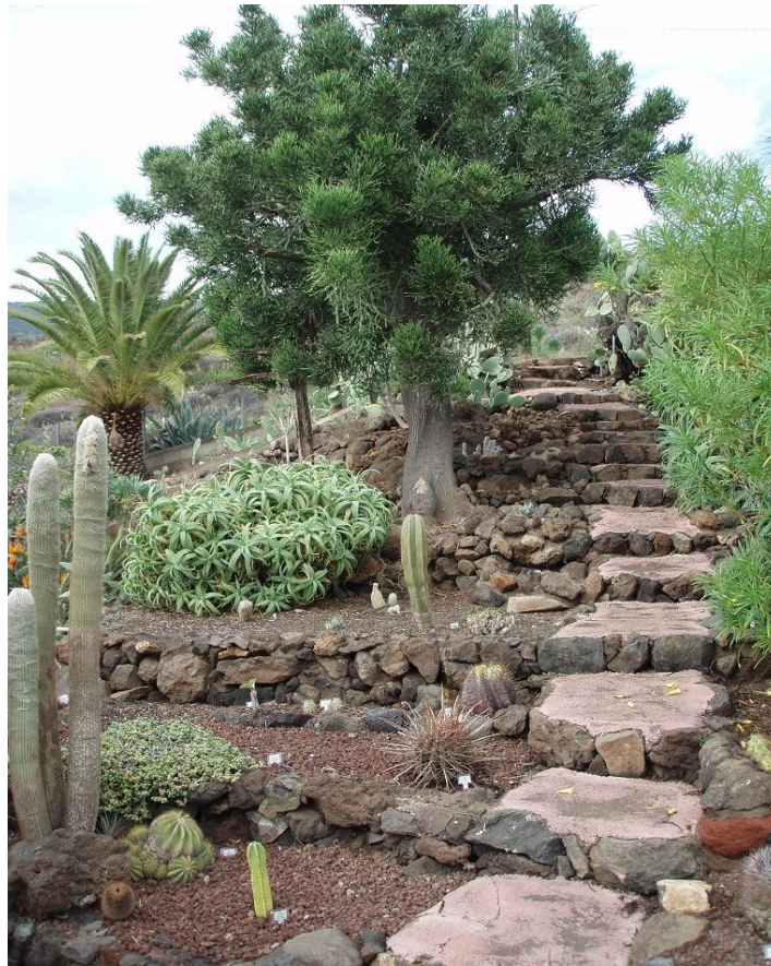
Aufgang in den oberen Teil des Kakteengartens