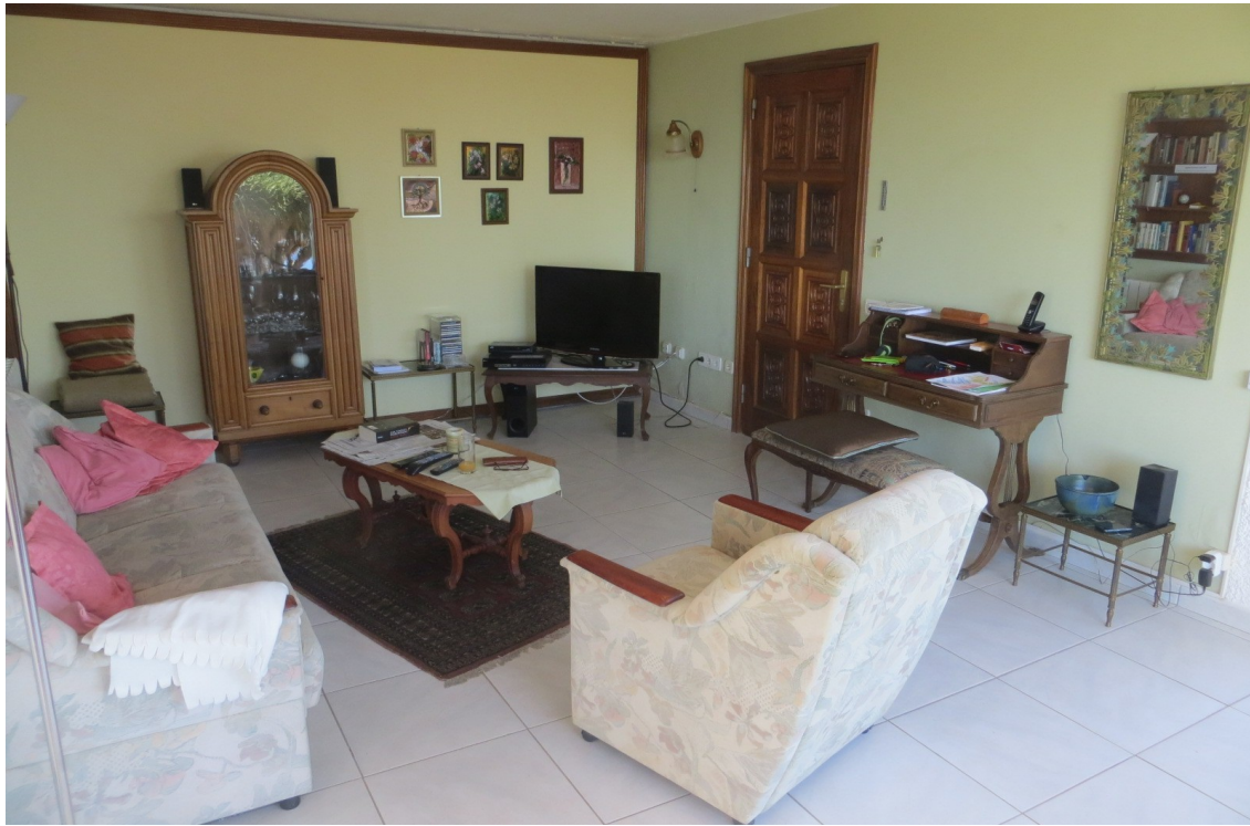
Wohnzimmer, mit Sat-TV und DVD-Player