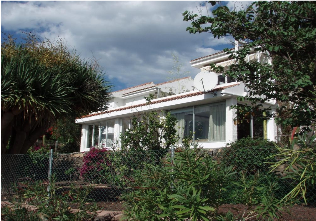
Blick von unten auf das Wohnzimmer und die teilverglaste untere Terrasse