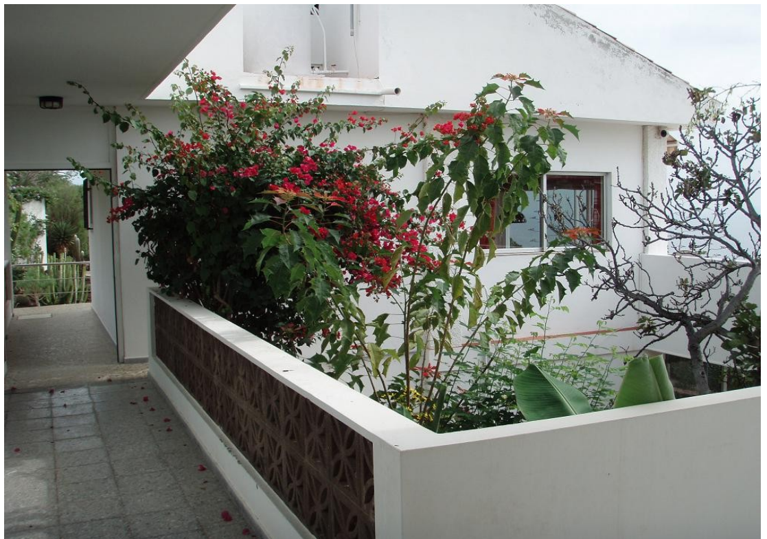
Begrünter Innenhof, oben, vom Schlaftrakt aus gesehen