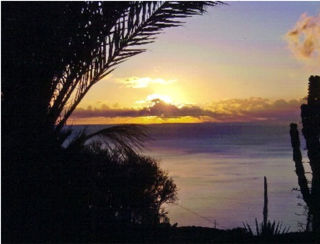
Ausblick bei Sonnenaufgang