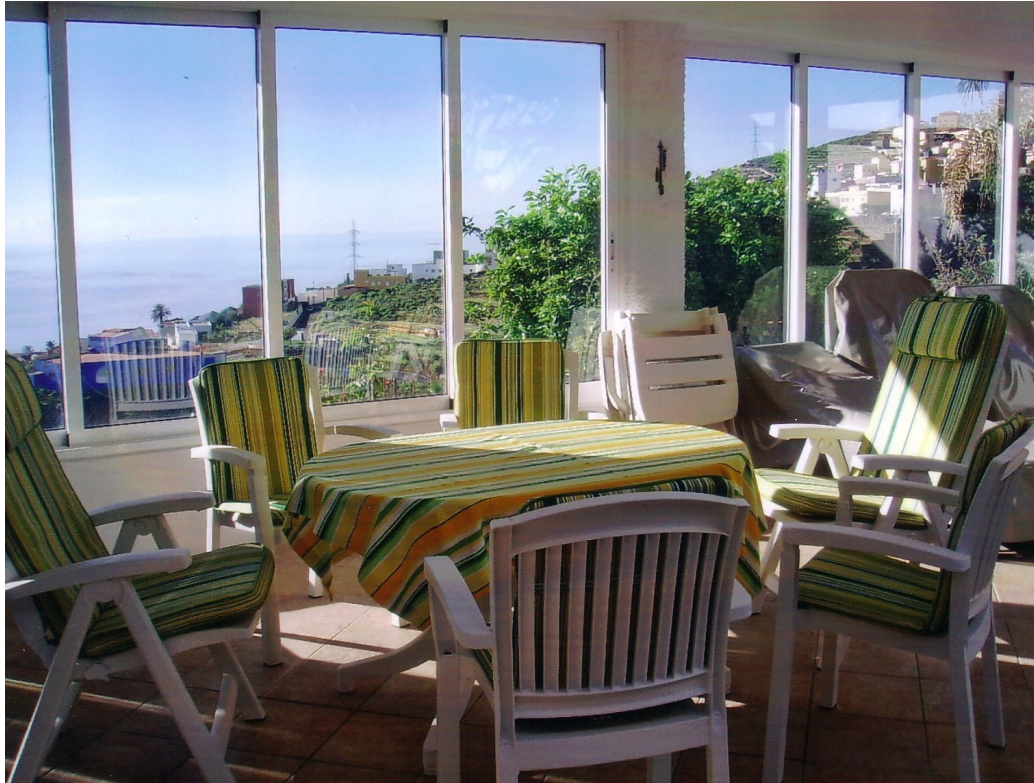
Untere Terrasse, vorderer Bereich