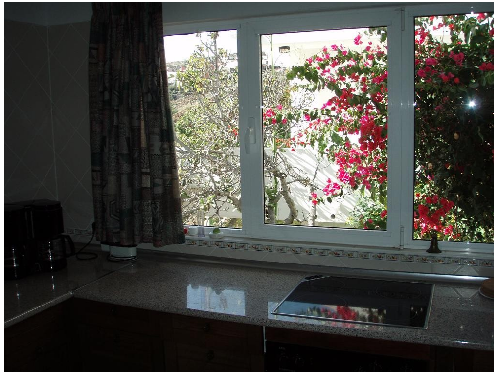
Küche mit Blick in den Innenhof