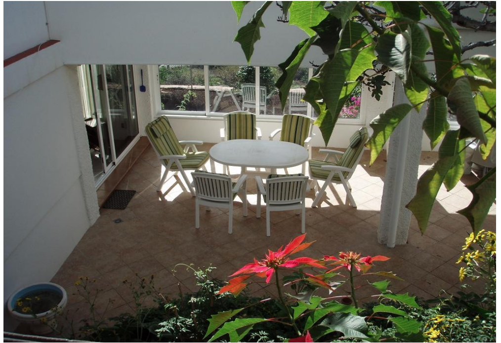
Blick durch den begrünten Innenhof auf die untere Terrasse