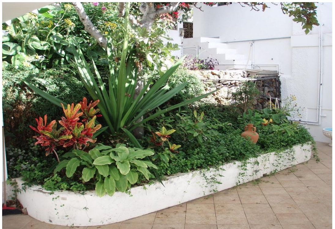
Begrünter Innenhof, von der unteren Terrasse aus gesehen