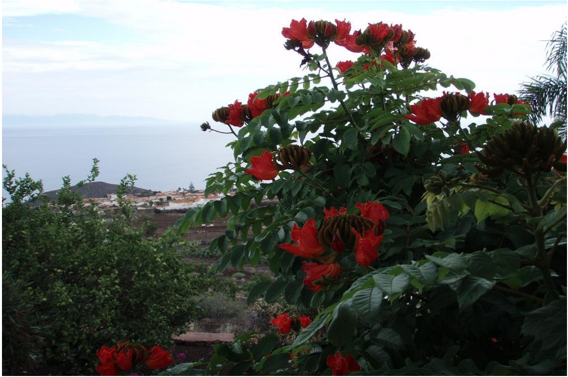
Blick aus dem rechten Schlafzimmer