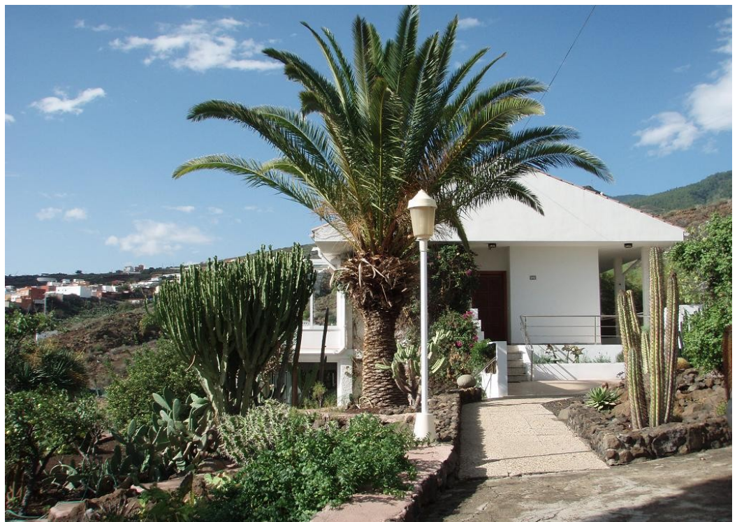
Eingangsbereich, vorderer Trakt